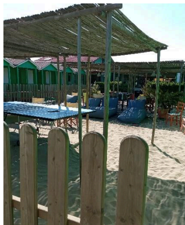
Area giochi con tavolo ping pong